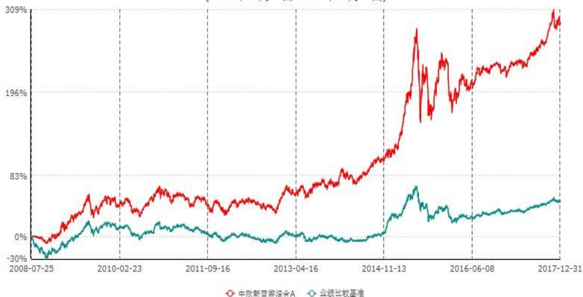
中欧新蓝筹混合A累计净值增长率与业绩比较基准收益率历史走势对比图 (2008年07月25日-2017年12月31日)