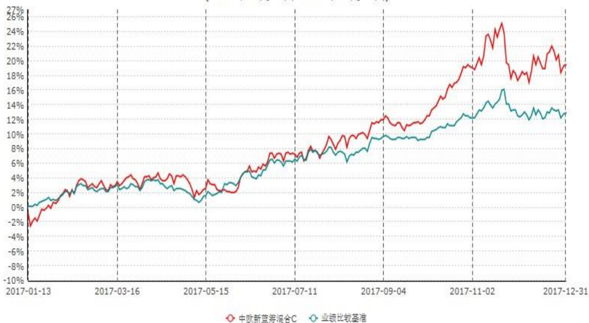
中欧新蓝筹混合C累计净值增长率与业绩比较基准收益率历史走势对比图 (2017年01月13日-2017年12月31日)

注：本基金于 2017 年 01 月 12 日新增 C 类份额，图示日期为 2017 年 01 月 13 日至 2017 年 12 月 31 日。