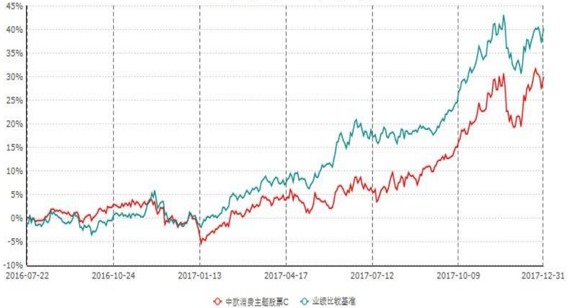
中欧消费主题股票C累计净值增长率与业绩比较基准收益率历史走势对比图 (2016年07月22日-2017年12月31日)

注：本基金基金合同生效日期为 2016 年 7 月 22 日，按基金合同的规定，本基金自基金合同生效起六个月为建仓期，建仓期结束时本基金的各项资产配置比例已达到基金合同的规定。