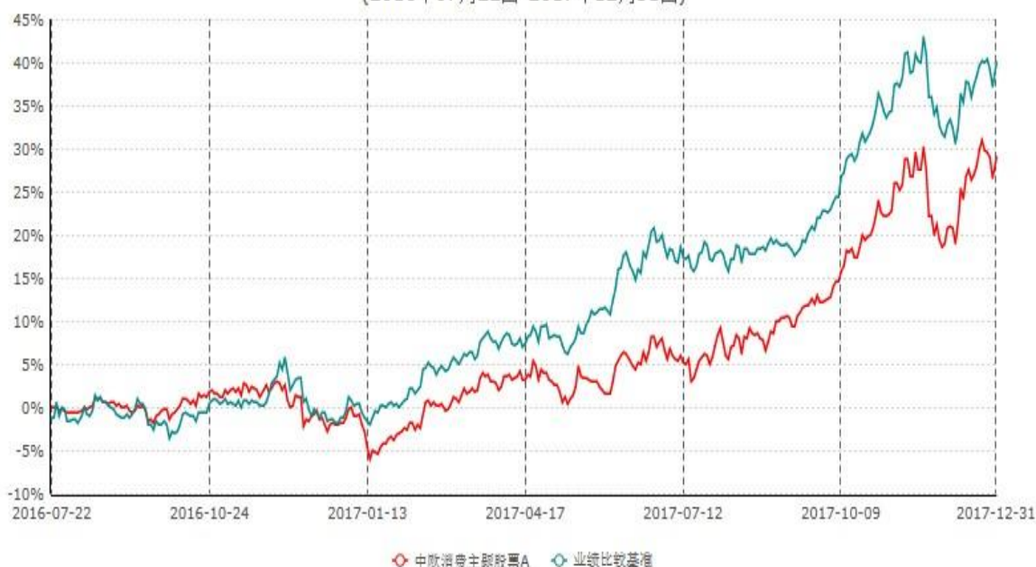
中欧消费主题股票A累计净值增长率与业绩比较基准收益率历史走势对比图 (2016年07月22日-2017年12月31日)