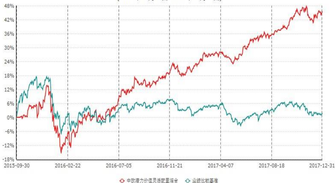
中欧潜力价值灵活配置混合型证券投资基金累计净值增长率与业绩比较基准收益率历史走势对比图 (2015年09月30日-2017年12月31日)