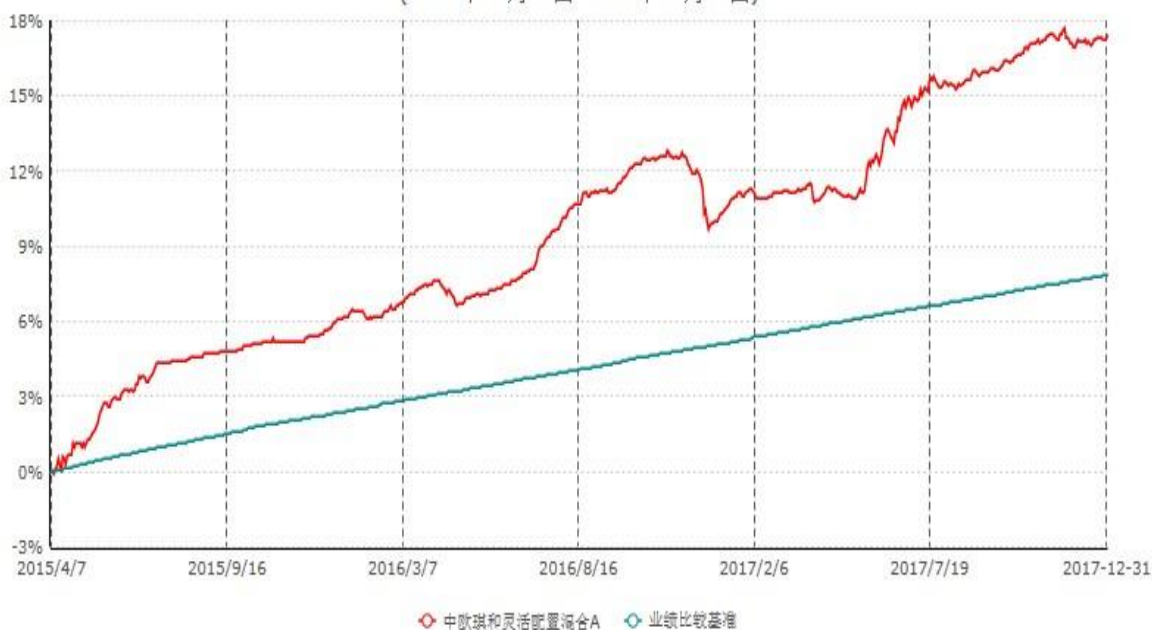
中欧琪和灵活配置混合A累计净值增长率与业绩比较基准收益率历史走势对比图 (2015年04月07日-2017年12月31日)