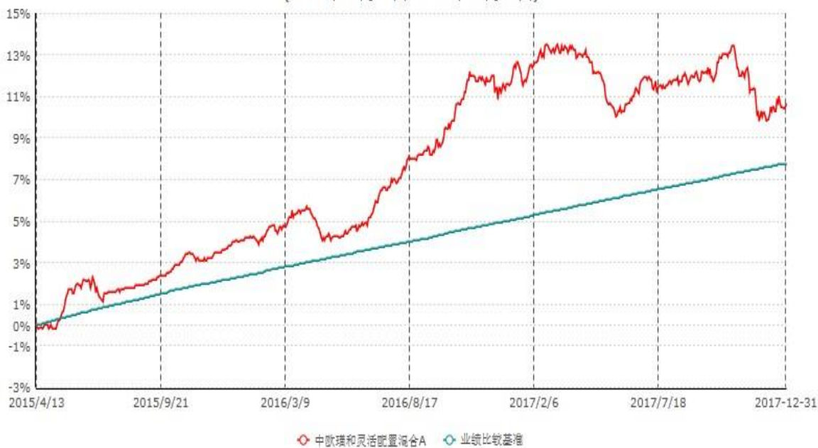
中欧瑾和灵活配置混合A累计净值增长率与业绩比较基准收益率历史走势对比图 (2015年04月13日-2017年12月31日)