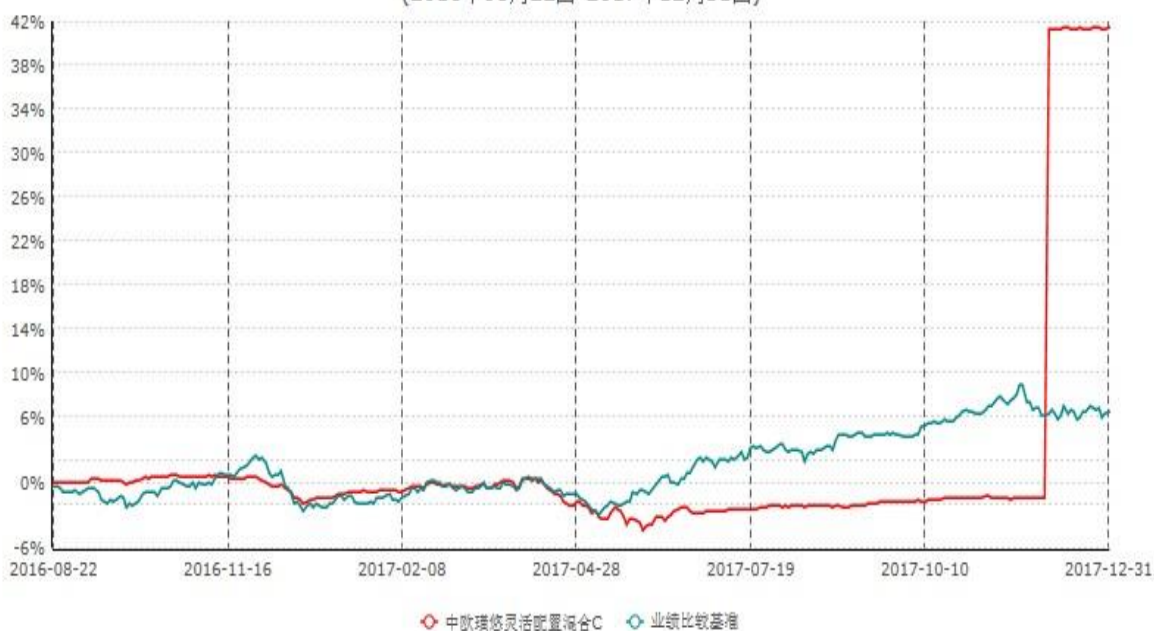
中欧瑾悠灵活配置混合C累计净值增长率与业绩比较基准收益率历史走势对比图 (2016年08月22日-2017年12月31日)

注：本基金基金合同生效日期为 2016 年 8 月 22 日，按基金合同的规定，本基金自基金合同生效起六个月为建仓期，建仓期结束时本基金的各项资产配置比例已达到基金合同的规定