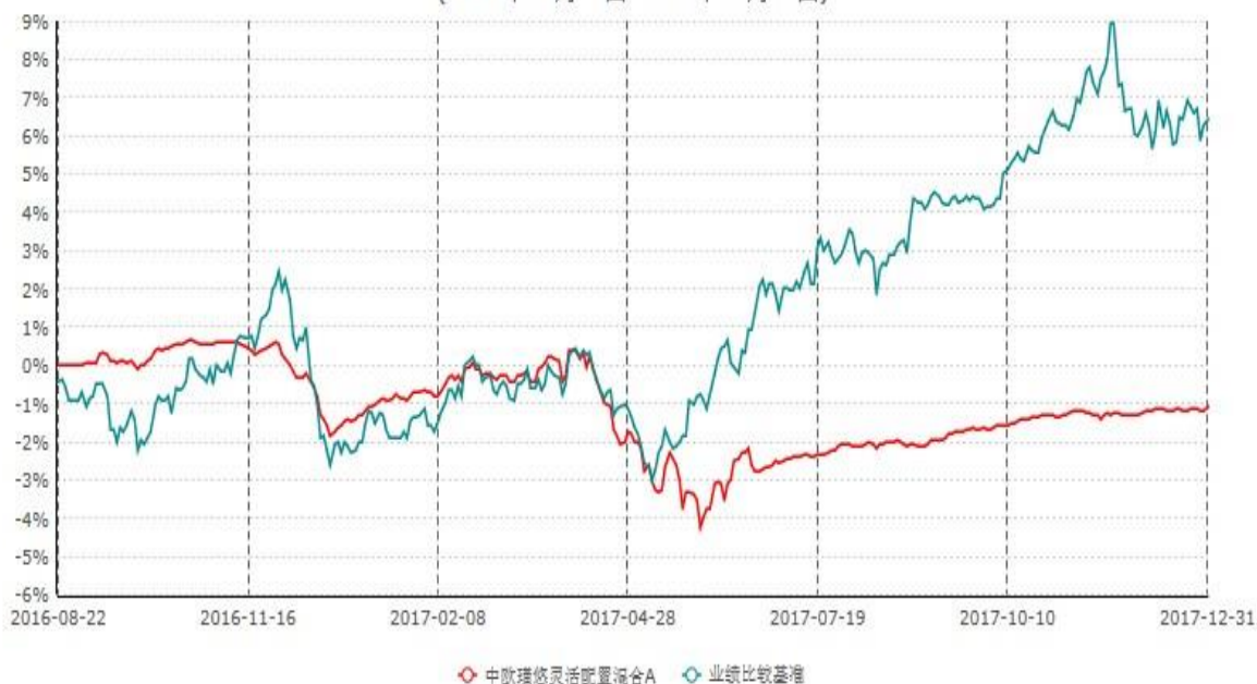
中欧瑾悠灵活配置混合A累计净值增长率与业绩比较基准收益率历史走势对比图 (2016年08月22日-2017年12月31日)

注：本基金基金合同生效日期为 2016 年 8 月 22 日，按基金合同的规定，本基金自基金合同生效起六个月为建仓期，建仓期结束时本基金的各项资产配置比例已达到基金合同的规定