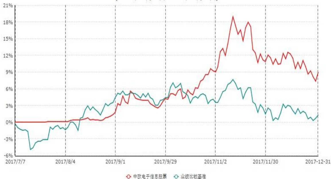
中欧电子信息产业沪港深股票型证券投资基金累计净值增长率与业绩比较基准收益率历史走势对比图 (2017年07月07日-2017年12月31日)

注：本基金基金合同生效日期为2017年7月7日，自基金合同生效日起到本报告期末不满一年，按基金合同的规定，本基金自基金合同生效起六个月为建仓期，建仓期结束时各项资产配置比例应当符合基金合同约定。