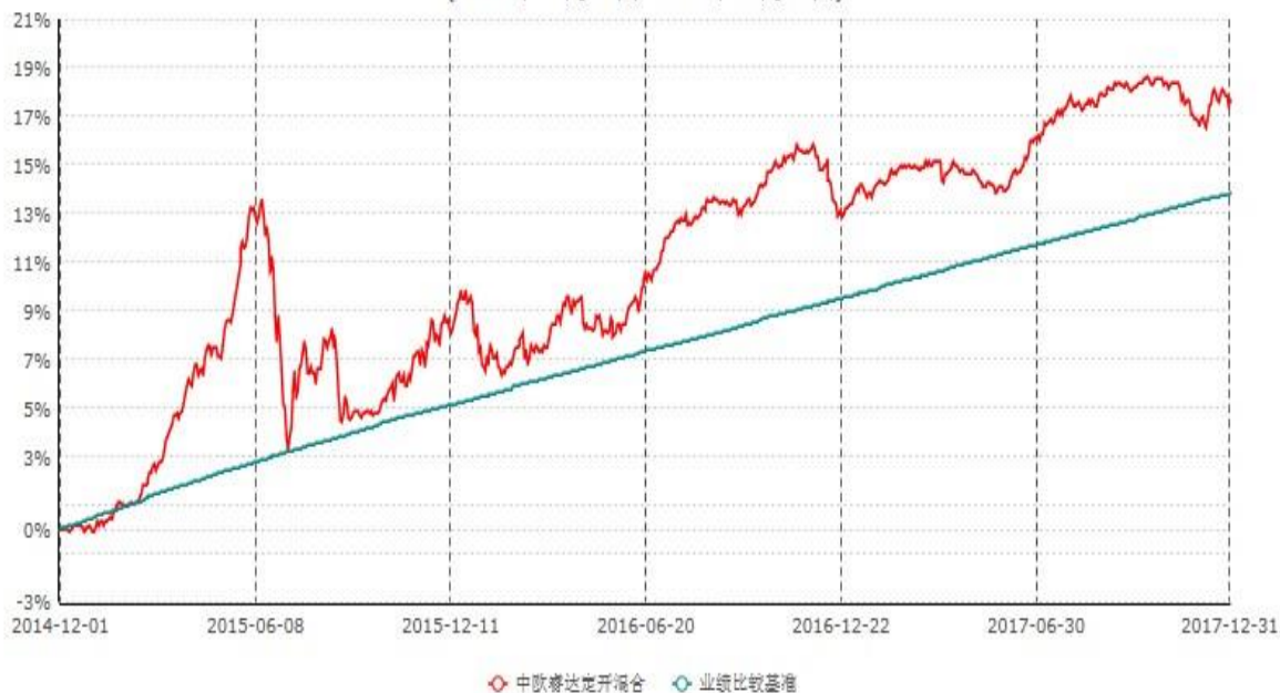
中欧睿达定期开放混合型发起式证券投资基金累计净值增长率与业绩比较基准收益率历史走势对比图 (2014年12月01日-2017年12月31日)