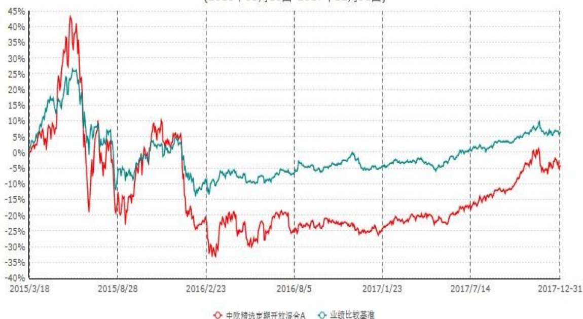
中欧精选定期开放混合A累计净值增长率与业绩比较基准收益率历史走势对比图 (2015年03月18日-2017年12月31日)