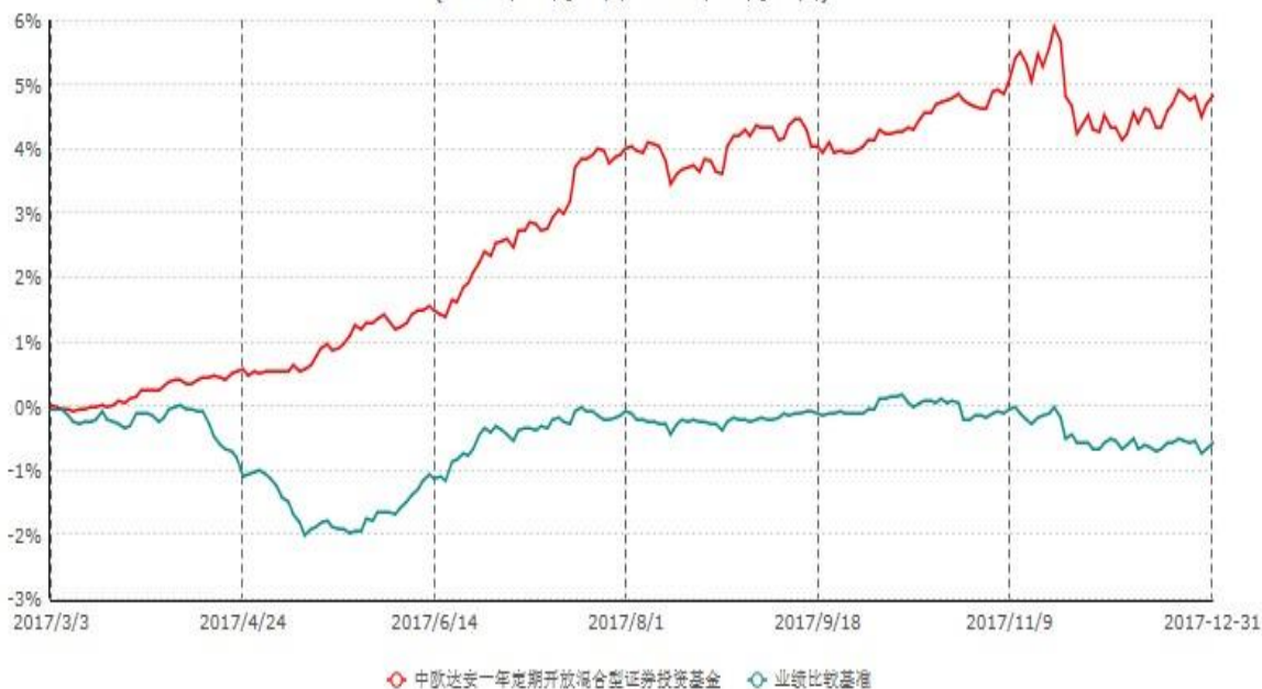
中欧达安一年定期开放混合型证券投资基金累计净值增长率与业绩比较基准收益率历史走势对比图 (2017年03月03日-2017年12月31日)