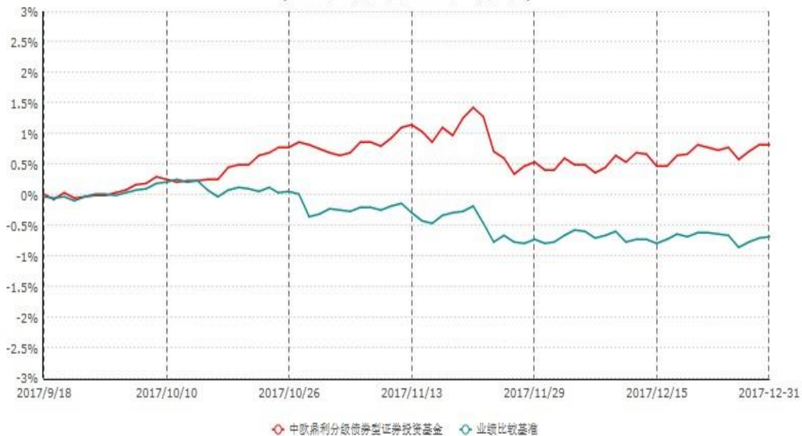
中欧鼎利分级债券型证券投资基金累计净值增长率与业绩比较基准收益率历史走势对比图 (2017年09月18日-2017年12月31日)

注：自2017年9月15日中欧鼎利分级债券型证券投资基金结束分级运作且鼎利A和鼎利B份额终止上市起，原中欧鼎利分级债券型证券投资基金名称变更为中欧鼎利债券型证券