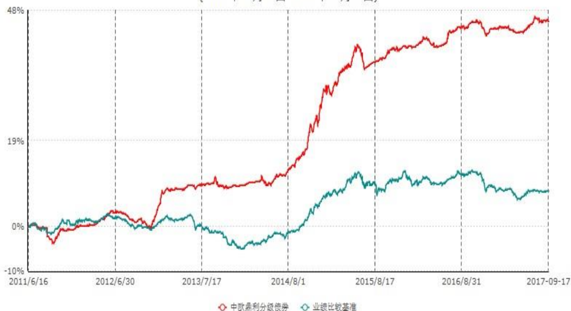
中欧鼎利分级债券型证券投资基金累计净值增长率与业绩比较基准收益率历史走势对比图 (2011年06月16日-2017年09月17日)