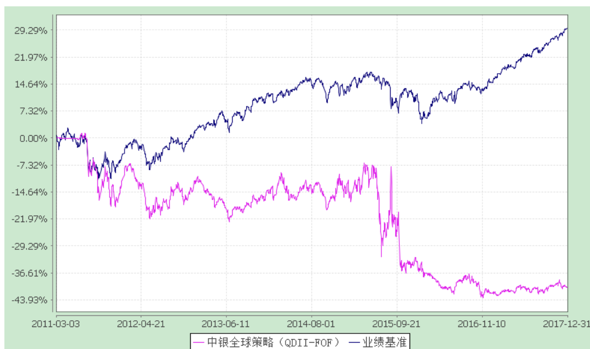
中银全球策略证券投资基金（FOF） 份额累计净值增长率与业绩比较基准收益率历史走势对比图 (2011年3月3日至2017年12月31日)

注：按基金合同规定，本基金自基金合同生效起 6 个月内为建仓期，截至建仓结束时本基金的 各项投资比例已达到基金合同第十二部分（二）的规定，即本基金的基金投资不低于本基金资产的 60%，现金和到期日在一年以内的政府债券不低于基金资产净值的 5%。