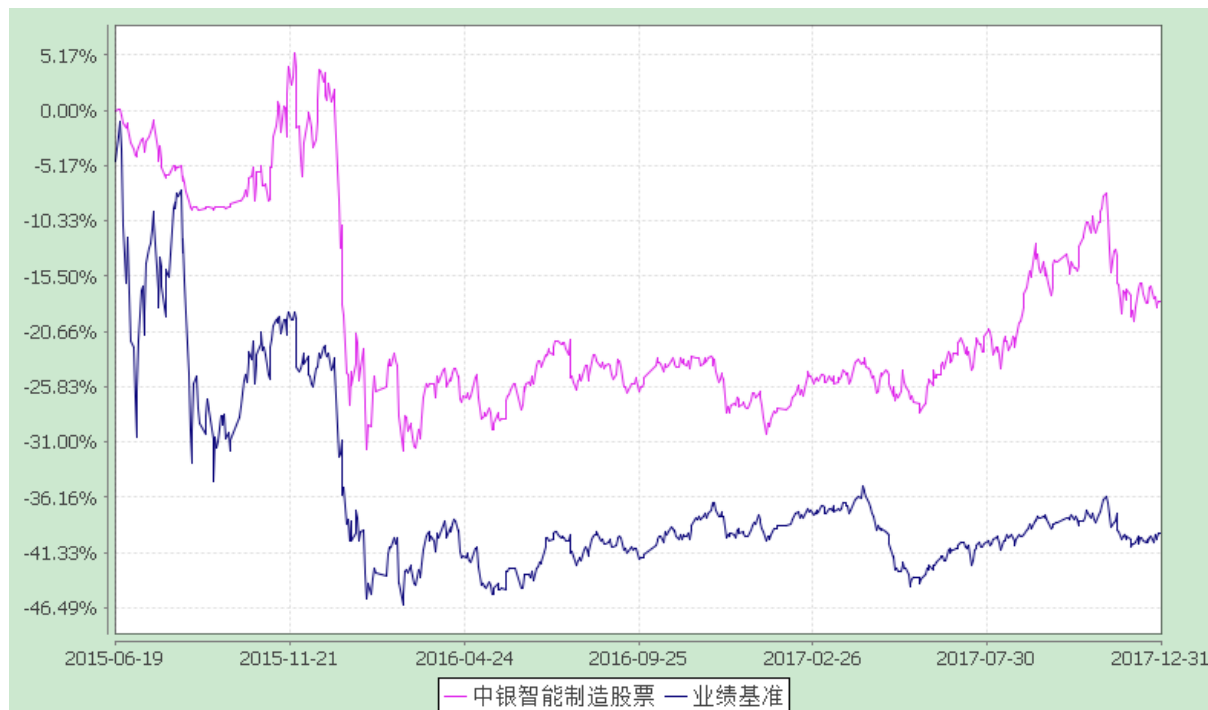
份额累计净值增长率与业绩比较基准收益率的历史走势对比图 (2015 年 6 月 19 日至 2017 年 12 月 31 日)

注：按基金合同规定，本基金自基金合同生效起 6 个月内为建仓期，截至建仓结束时本基金的各项投资比例已达到基金合同第十二部分（二）的规定，即本基金股票投资占基金资产的比例范围为 80-95%，其中投资于智能制造主题相关股票的比例不低于非现金基金资产的 80%。债券、债券回购、银行存款（包括协议存款、定期存款及其他银行存款）、货币市场工具、权证、股指期货以及法律法规或中国证监会允许基金投资的其他金融工具不低于基金资产净值的 5%。本基金每个交易日日终在扣除股指期货需缴纳的交易保证金后，应当保持不低于基金资产净值 5% 的现金或者到期日在一年以内的政府债券。