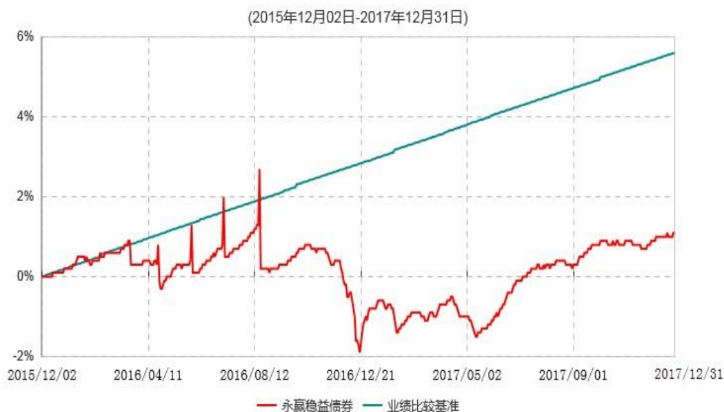
永赢稳益债券型证券投资基金累计净值增长率与业绩比较基准收益率历史走势对比图