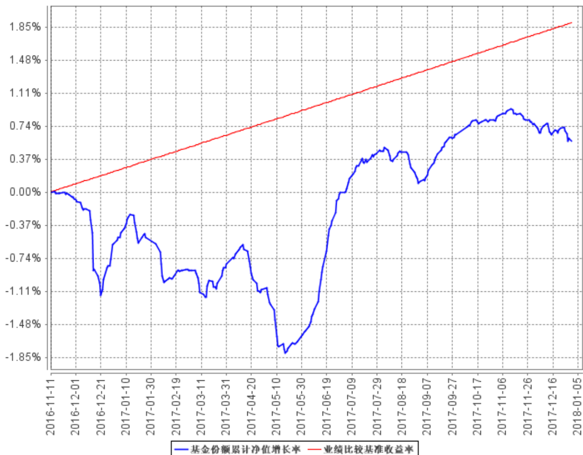
基金份额累计净值增长率与同期业绩比较基准收益率的历史走势对比图

注：按基金合同的规定，本基金自基金合同生效起六个月为建仓期，建仓期结束时本基金的各项资产配置比例已达到基金合同的规定：债券投资占基金资产的比例不低于 80%，但在每次开放期前一个月、开放期及开放期结束后一个月的期间内，基金投资不受上述比例限制；在开放期内，每个交易日日终在扣除国债期货合约需缴纳的交易保证金后，现金或者到期日在一年以内的政府债券不低于基金资产净值的 5%。在封闭期内，本基金不受上述 5% 的限制，但每个交易日日终在扣除国债期货合约需缴纳的交易保证金后，应当保持不低于交易保证金一倍的现金。