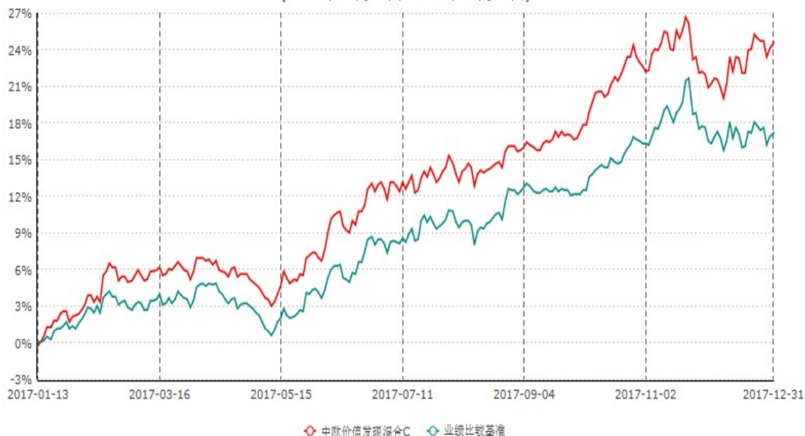
中欧价值发现混合C累计净值增长率与业绩比较基准收益率历史走势对比图 (2017年01月13日-2017年12月31日)

注：自 2017 年 01 月 12 日起，本基金增加 C 类份额。图示日期为 2017 年 01 月 13 日至 2017 年 12 月 31 日。