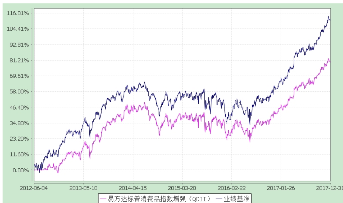
易方达标普全球高端消费品指数增强型证券投资基金 份额累计净值增长率与业绩比较基准收益率历史走势对比图 (2012年6月4日至2017年12月31日)