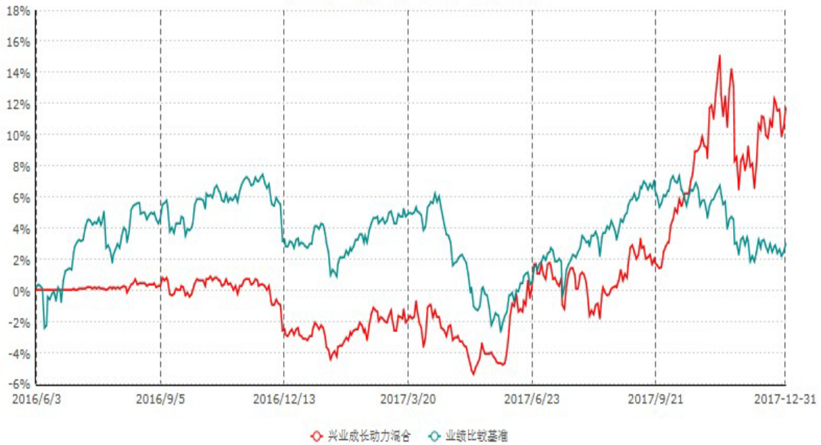
兴业成长动力灵活配置混合型证券投资基金累计净值增长率与业绩比较基准收益率历史走势对比图 (2016年06月03日-2017年12月31日)