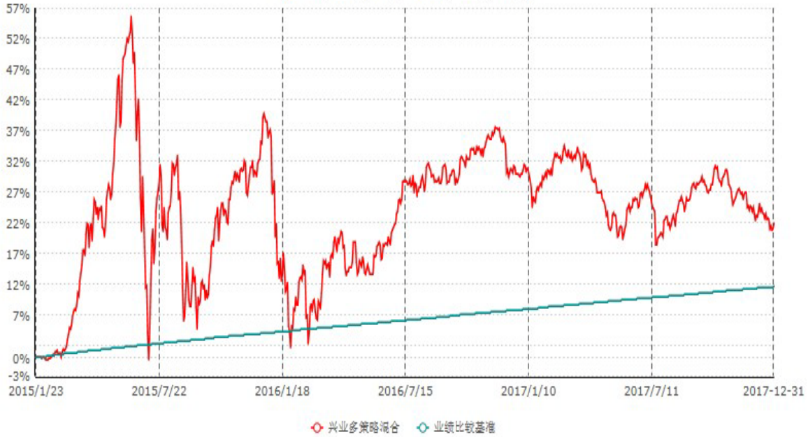
兴业多策略灵活配置混合型发起式证券投资基金累计净值增长率与业绩比较基准收益率历史走势对比图 (2015年01月23日-2017年12月31日)