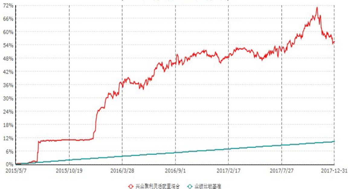
兴业聚利灵活配置混合型证券投资基金累计净值增长率与业绩比较基准收益率历史走势对比图 (2015年05月07日-2017年12月31日)