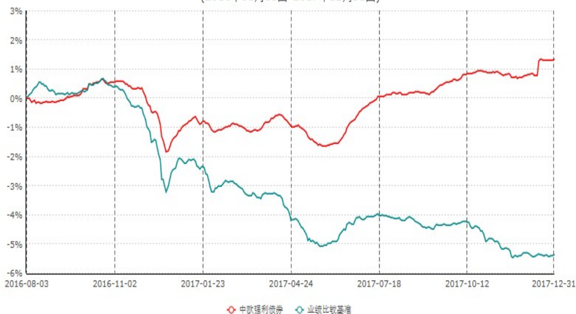
中欧强利债券型证券投资基金累计净值增长率与业绩比较基准收益率历史走势对比图 (2016年08月03日-2017年12月31日)

注：本基金基金合同生效日期为2016年8月3日，按基金合同的规定，本基金自基金合同生效起六个月为建仓期，建仓期结束时本基金的各项资产配置比例已达到基金合同的规定。