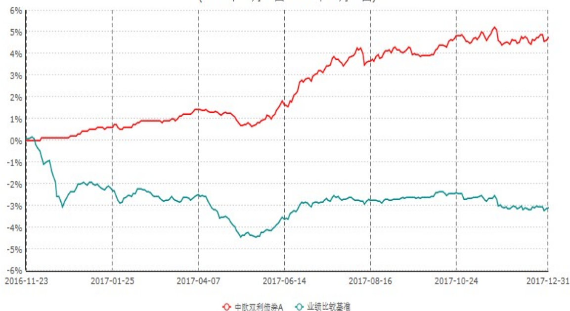
中欧双利债券A累计净值增长率与业绩比较基准收益率历史走势对比图 (2016年11月23日-2017年12月31日)

注：本基金基金合同生效日期为2016年11月23日，按基金合同的规定，本基金自基金合同生效起六个月为建仓期，建仓期结束时本基金的各项资产配置比例已达到基金合同的规定。