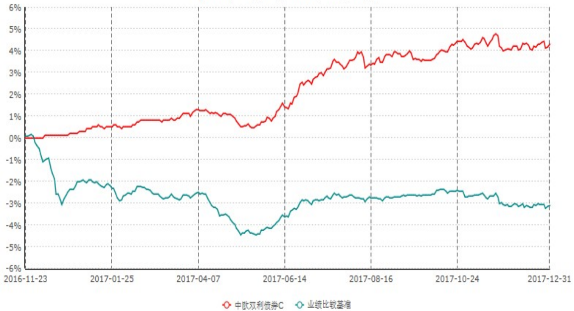
中欧双利债券C累计净值增长率与业绩比较基准收益率历史走势对比图 (2016年11月23日-2017年12月31日)

注：本基金基金合同生效日期为2016年11月23日，按基金合同的规定，本基金自基金合同生效起六个月为建仓期，建仓期结束时本基金的各项资产配置比例已达到基金合同的规定。