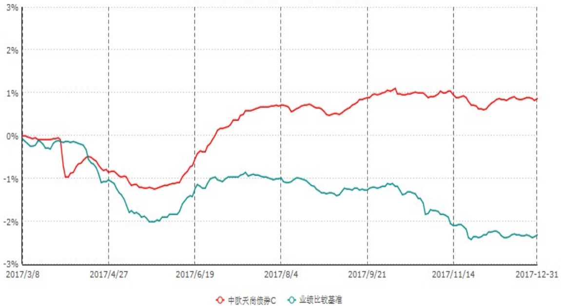
中欧天尚债券C累计净值增长率与业绩比较基准收益率历史走势对比图 (2017年03月08日-2017年12月31日)

注：本基金基金合同生效日期为 2017 年 3 月 8 日，自基金合同生效日起到本报告期末不满一年，按基金合同的规定，本基金自基金合同生效起六个月为建仓期，建仓期结束时本基金的各项资产配置比例已达到基金合同的规定