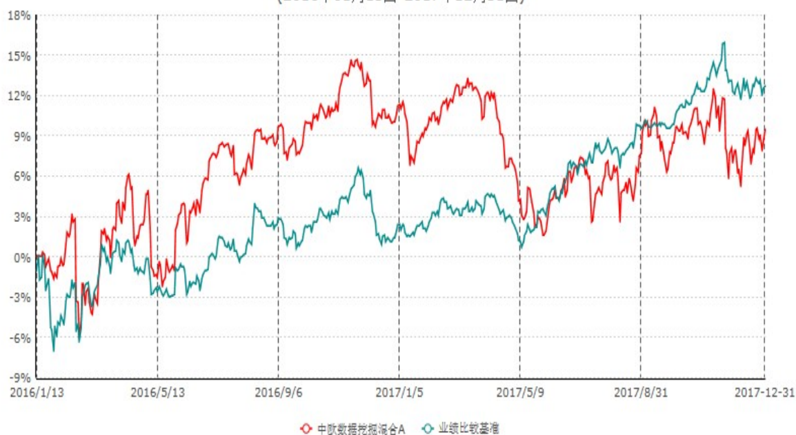
中欧数据挖掘混合A累计净值增长率与业绩比较基准收益率历史走势对比图 (2016年01月13日-2017年12月31日)