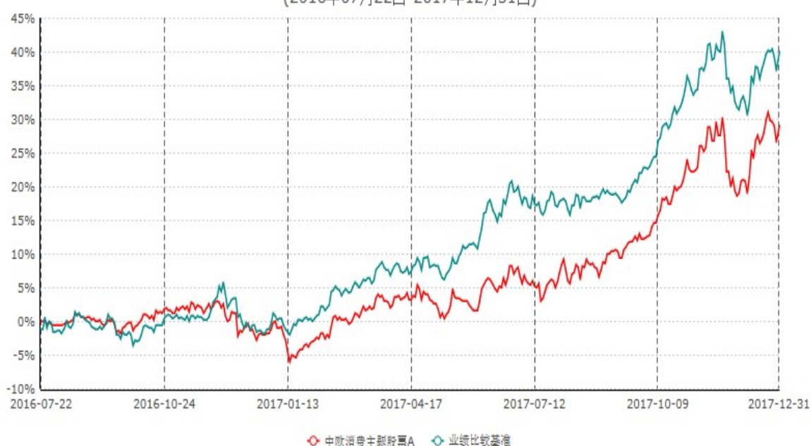
中欧消费主题股票A累计净值增长率与业绩比较基准收益率历史走势对比图 (2016年07月22日-2017年12月31日)

注：本基金基金合同生效日期为 2016 年 7 月 22 日，按基金合同的规定，本基金自基金合同生效起六个月为建仓期，建仓期结束时本基金的各项资产配置比例已达到基金合同的规定。