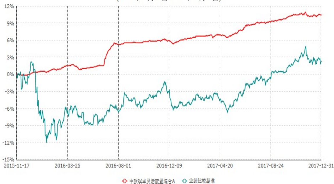
中欧琪丰灵活配置混合A累计净值增长率与业绩比较基准收益率历史走势对比图 (2015年11月17日-2017年12月31日)