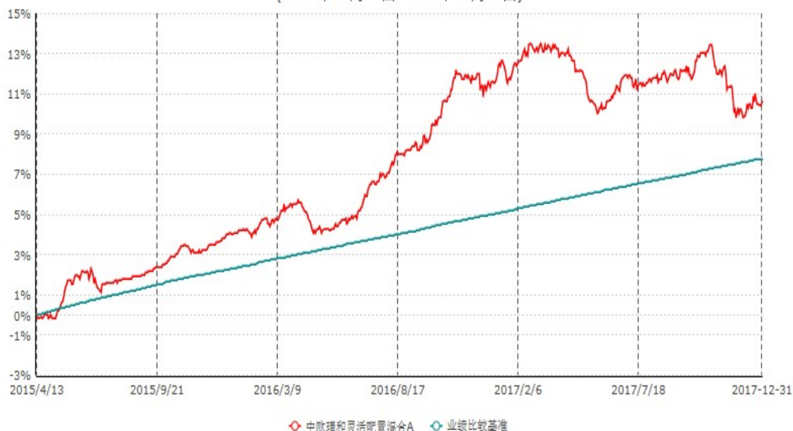
中欧瑾和灵活配置混合A累计净值增长率与业绩比较基准收益率历史走势对比图 (2015年04月13日-2017年12月31日)