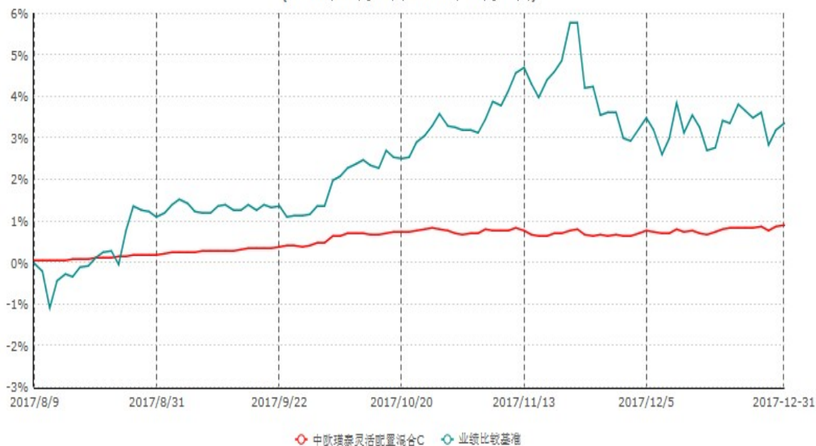
中欧瑾泰灵活配置混合C累计净值增长率与业绩比较基准收益率历史走势对比图 (2017年08月09日-2017年12月31日)

注：本基金基金合同生效日期为2017年8月9日，自基金合同生效日起到本报告期末不满一年，按基金合同的规定，本基金自基金合同生效起六个月为建仓期，建仓期结束时本基金的各项资产配置比例应当符合基金合同的规定