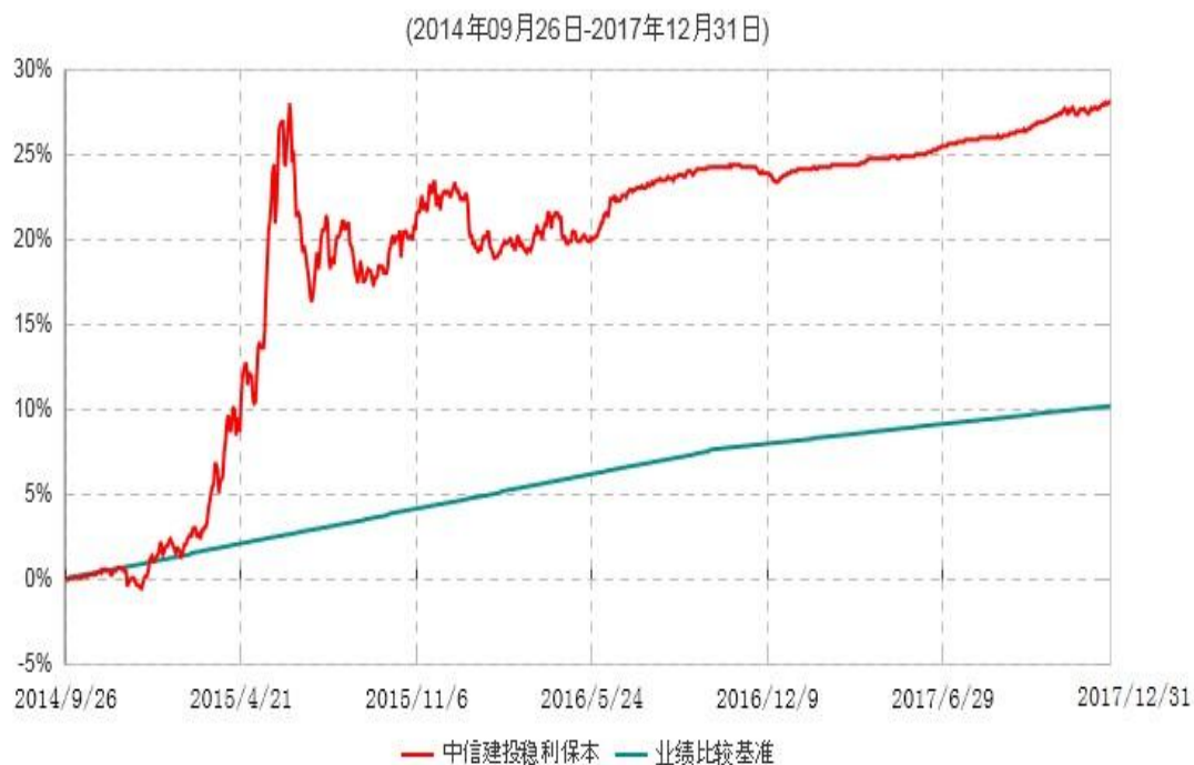
中信建投稳利保本混合型证券投资基金累计净值增长率与业绩比较基准收益率历史走势对比图