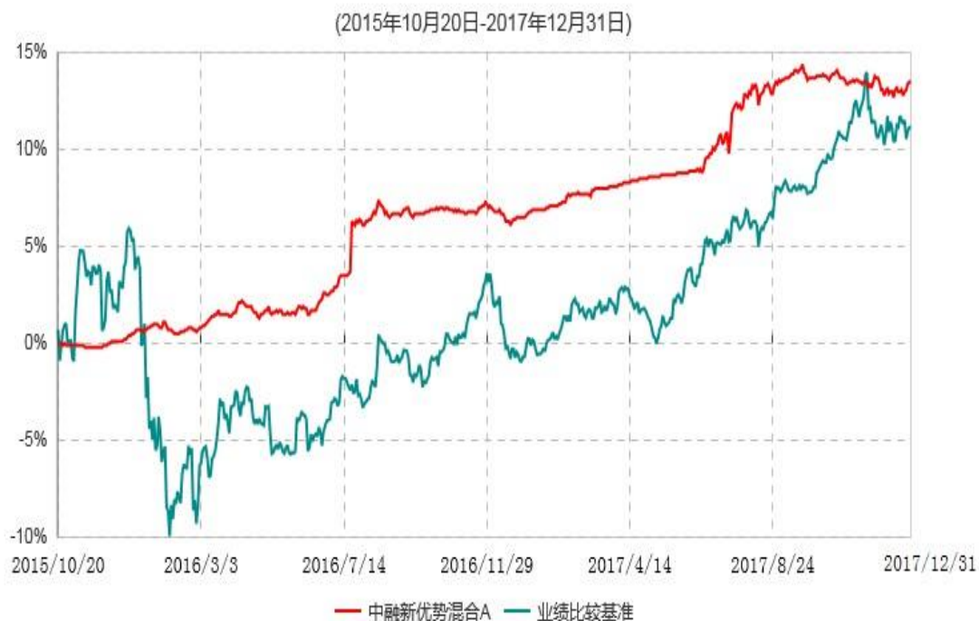
中融新优势混合A累计净值增长率与业绩比较基准收益率历史走势对比图