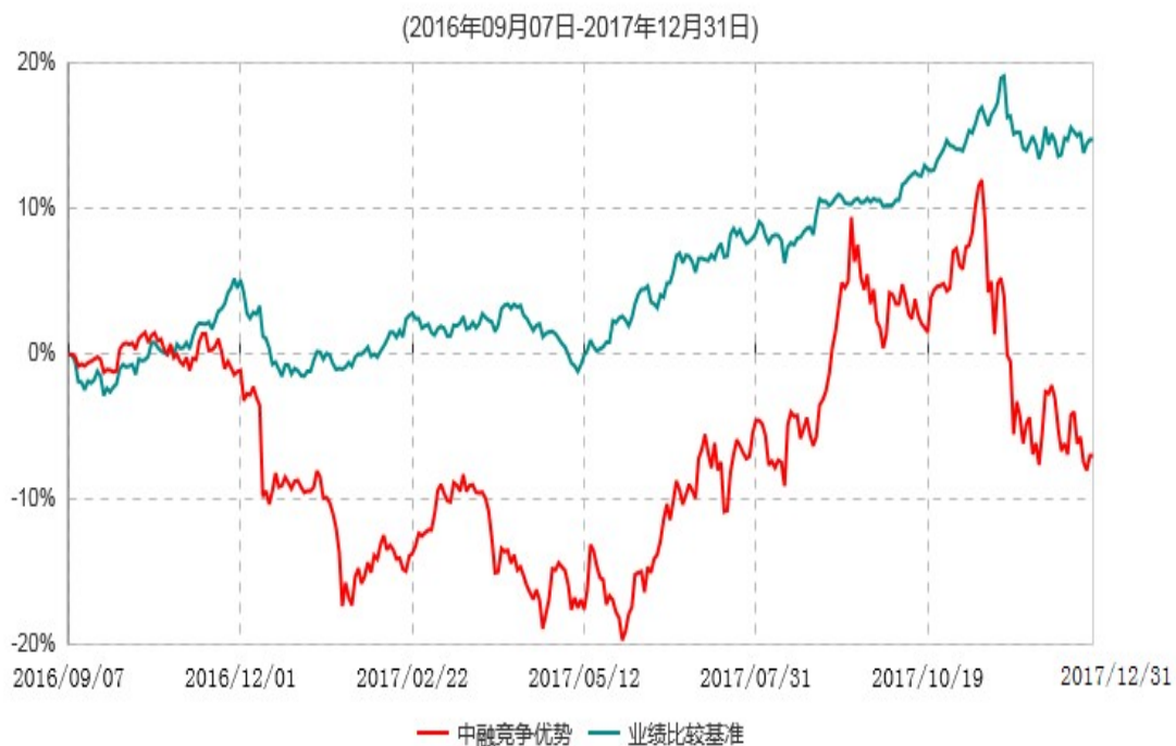
中融竞争优势股票型证券投资基金累计净值增长率与业绩比较基准收益率历史走势对比图

注：按照基金合同和招募说明书的约定，本基金自合同生效日起6个月内为建仓期，建仓期结束时本基金的各项资产配置比例符合基金合同的有关约定。