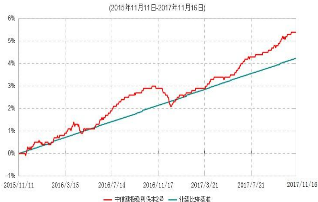
中信建投稳利保本2号混合型证券投资基金累计净值增长率与业绩比较基准收益率历史走势对比图

注：根据《中信建投稳利保本2号混合型证券投资基金基金合同》的有关规定，2017年11月13日为本基金的第一个保本周期到期日。