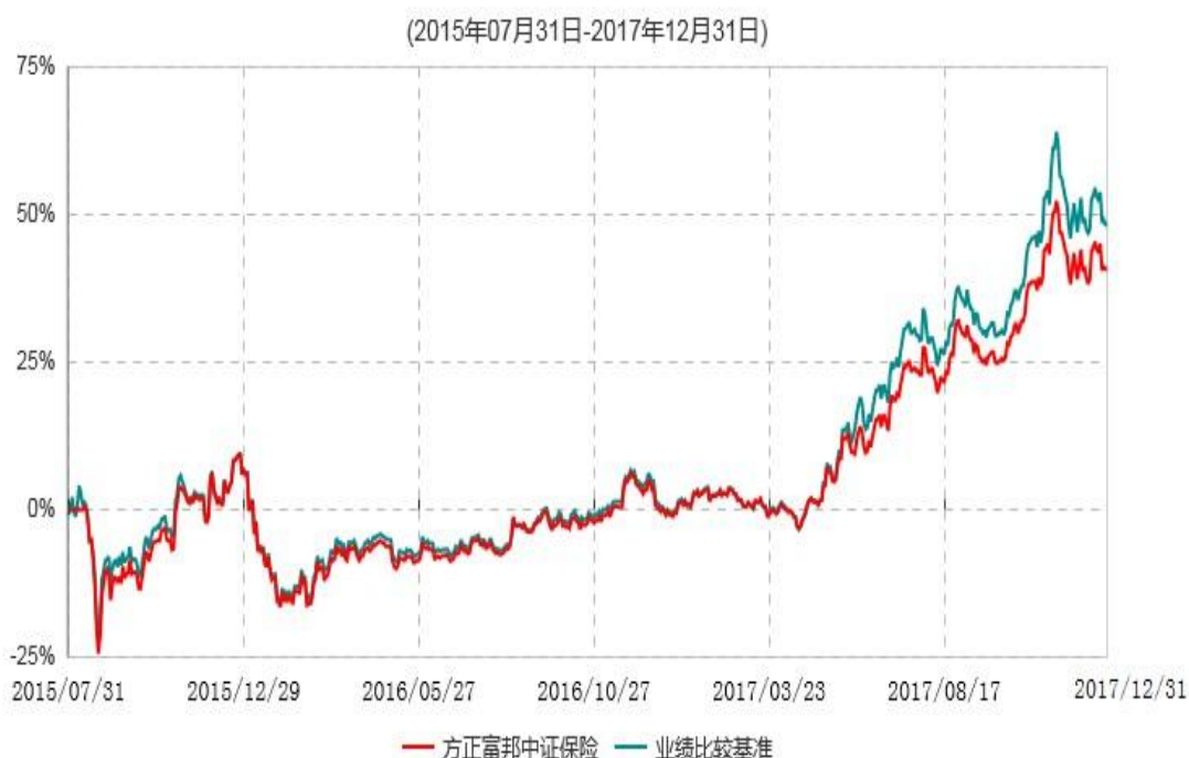
方正富邦中证保险主题指数分级证券投资基金累计净值增长率与业绩比较基准收益率历史走势对比图