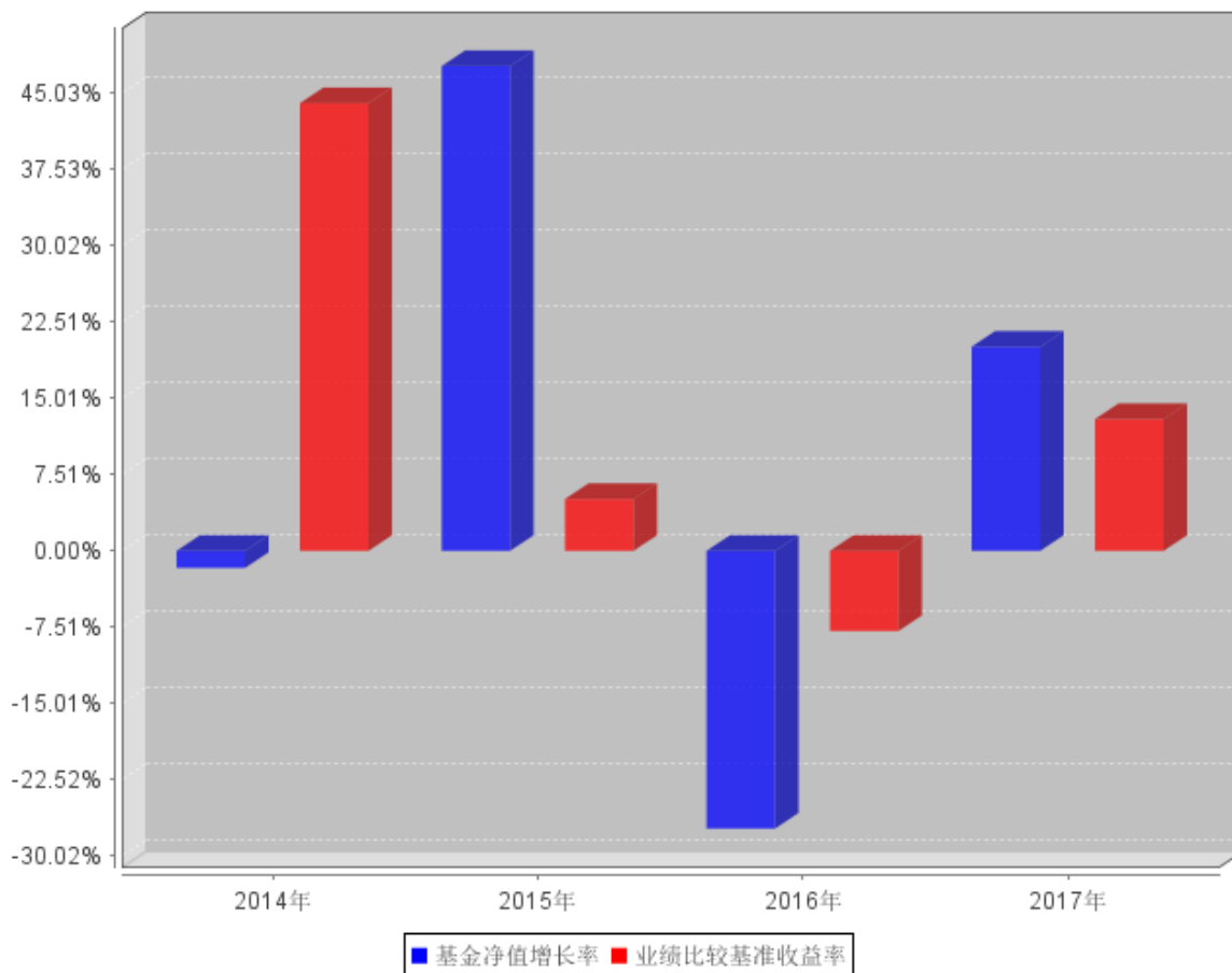
自基金合同生效以来基金每年净值增长率及其与同期业绩比较基准收益率的对比图

注：本基金于 2014 年 3 月 19 日成立，合同生效当年按实际存续期计算，不按整个自然年度进行折算。