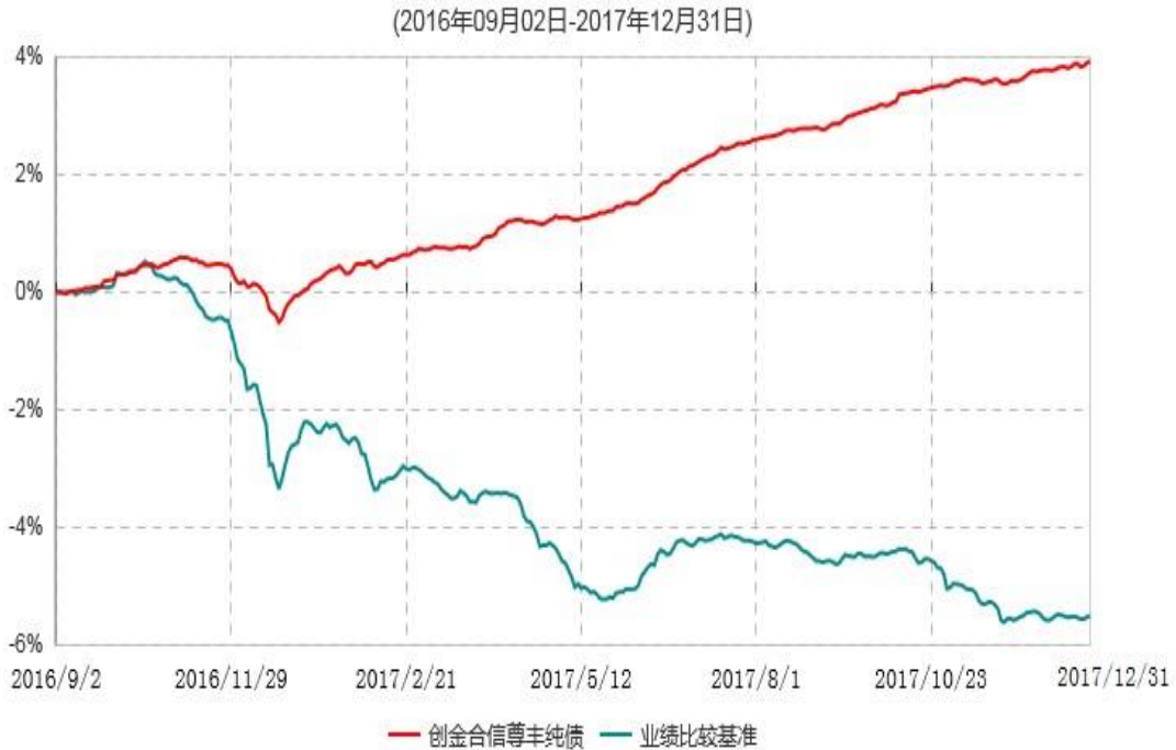
创金合信尊享纯债债券型证券投资基金累计净值增长率与业绩比较基准收益率历史走势对比图