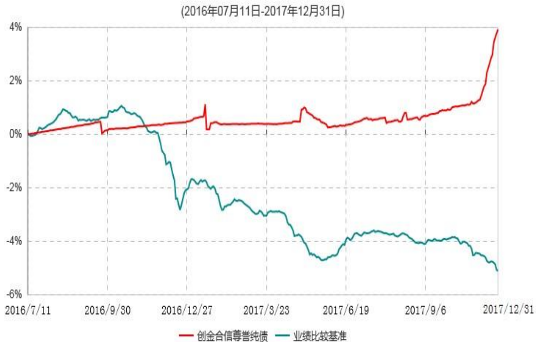
创金合信尊享纯债债券型证券投资基金累计净值增长率与业绩比较基准收益率历史走势对比图