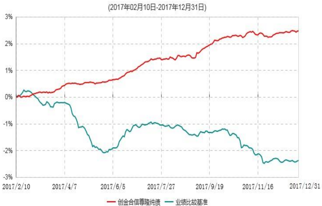
创金合信尊隆纯债债券型证券投资基金累计净值增长率与业绩比较基准收益率历史走势对比图