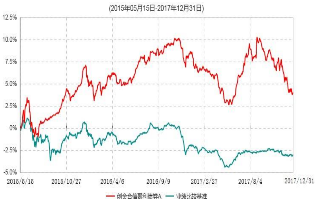
创金合信聚利债券A累计净值增长率与业绩比较基准收益率历史走势对比图