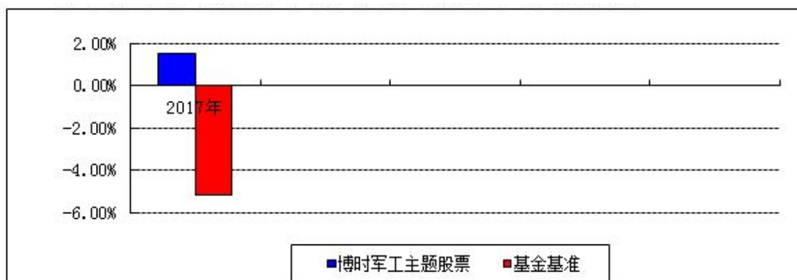
自基金合同生效以来基金净值增长率与业绩比较基准收益率的对比图

注：本基金合同于 2017 年 7 月 4 日生效，合同生效当年按实际存续期计算，不按整个自然年度进行折算。