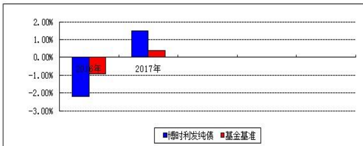
自基金合同生效以来基金净值增长率与业绩比较基准收益率的对比图

注：本基金合同于 2016 年 9 月 7 日生效，合同生效当年按实际存续期计算，不按整个自然年度进行折算。