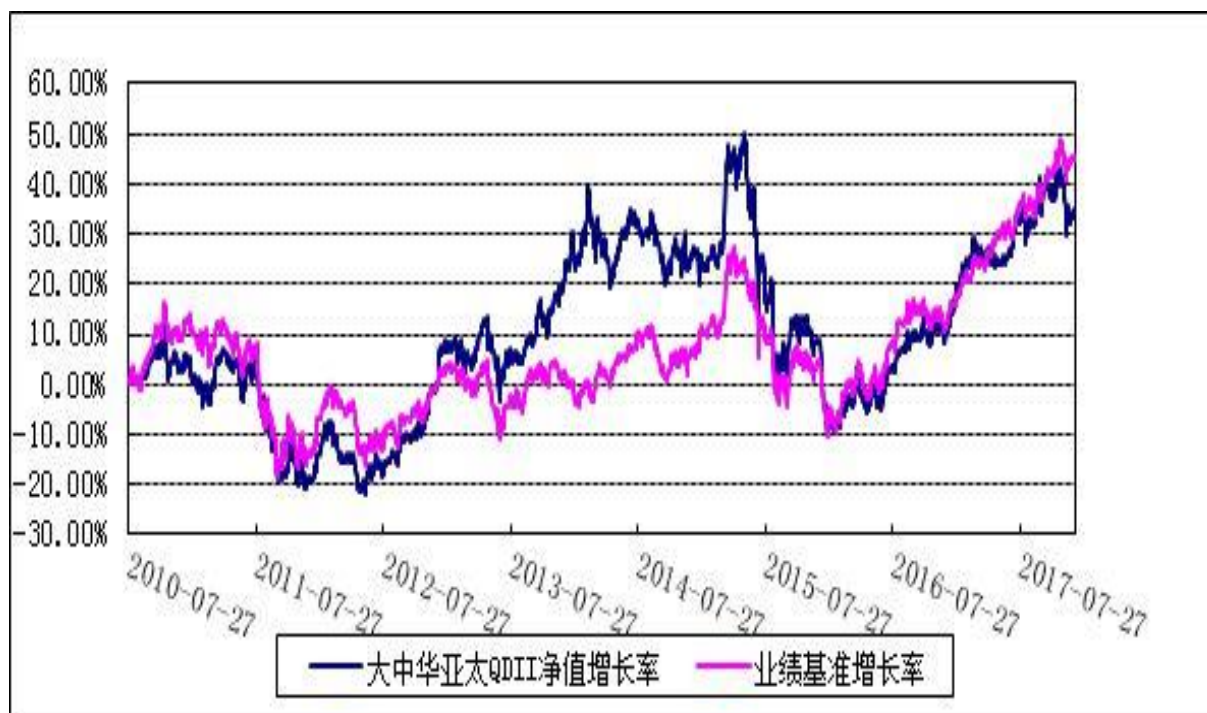
博时大中华亚太精选股票证券投资基金 份额累计净值增长率与业绩比较基准收益率历史走势对比图 (2010年7月27日至2017年12月31日)