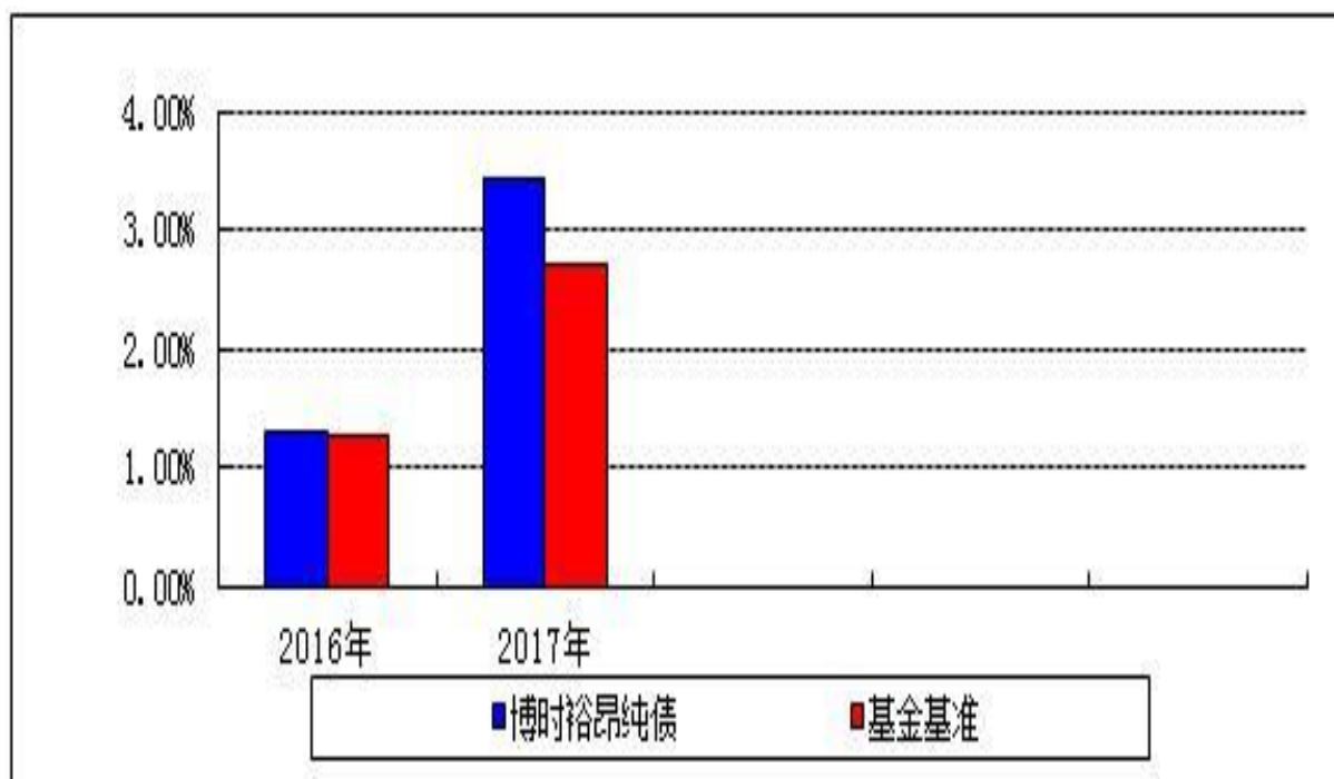
自基金合同生效以来基金净值增长率与业绩比较基准收益率的对比图

注：本基金合同于 2016 年 7 月 15 日生效，合同生效当年按实际存续期计算，不按整个自然年度进行折算。