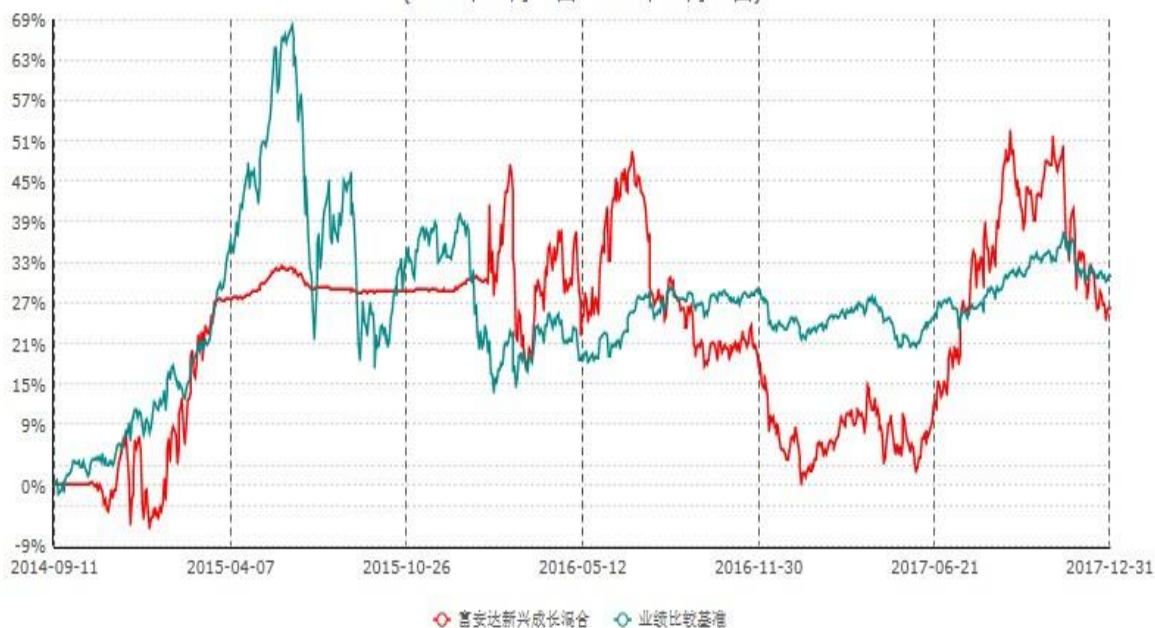
富安达新兴成长灵活配置混合型证券投资基金累计净值增长率与业绩比较基准收益率历史走势对比图 (2014年09月11日-2017年12月31日)

本基金于2014年9月11日成立。本基金建仓期为6个月，建仓截止日为2015年3月10日。建仓期结束时本基金各项资产配置比例符合本基金合同规定的比例限制及投资组合的比例范围。