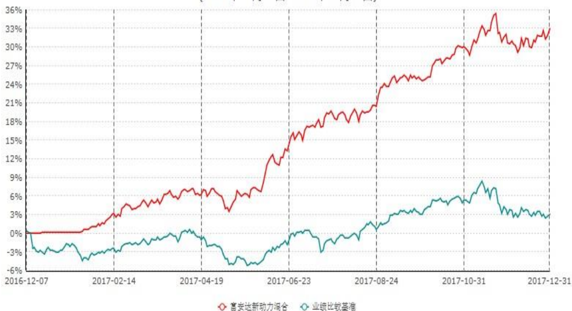
富安达新动力灵活配置混合型证券投资基金累计净值增长率与业绩比较基准收益率历史走势对比图 (2016年12月07日-2017年12月31日)