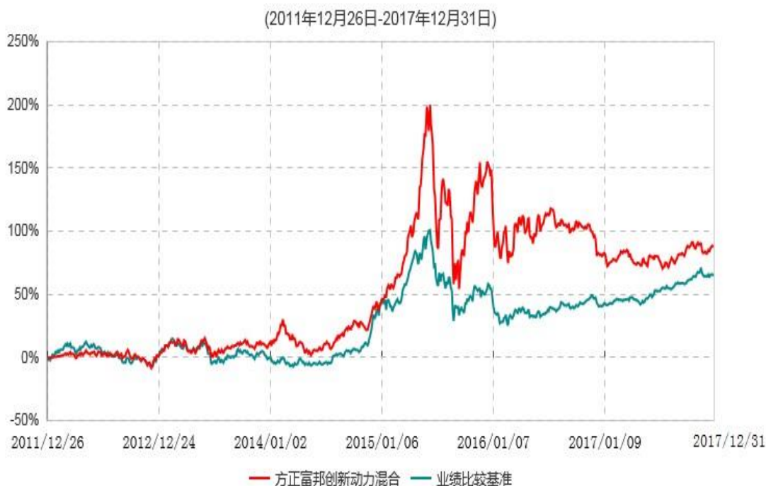
方正富邦创新动力混合型证券投资基金累计净值增长率与业绩比较基准收益率历史走势对比图