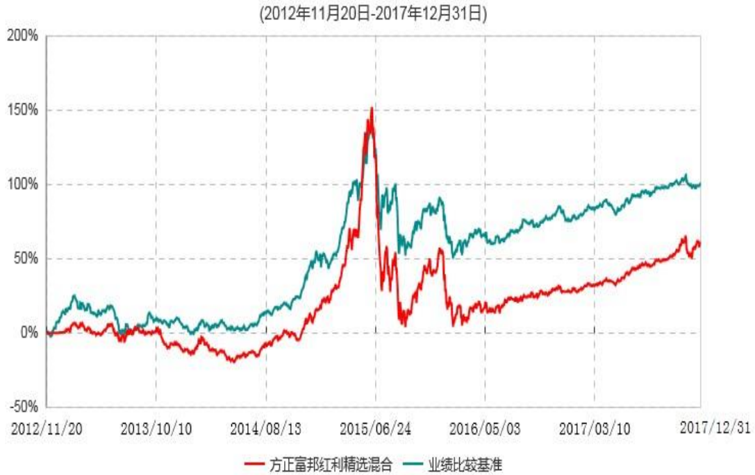
方正富邦红利精选混合型证券投资基金累计净值增长率与业绩比较基准收益率历史走势对比图