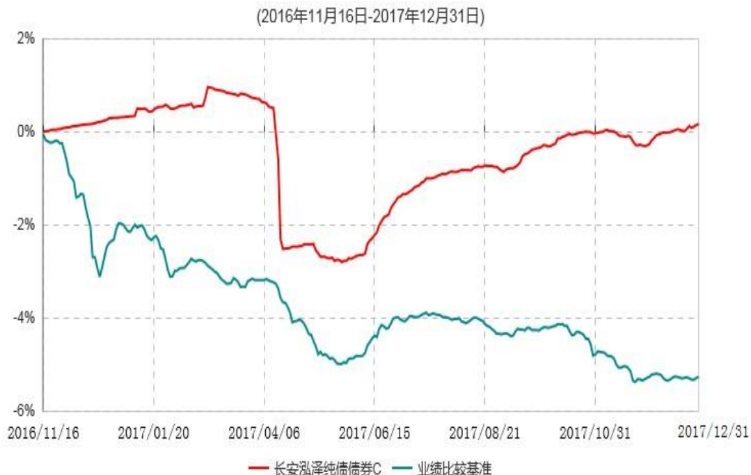
长安泓泽纯债债券C累计净值增长率与业绩比较基准收益率历史走势对比图

本基金基金合同生效日为2016年11月16日，按基金合同规定，本基金自基金合同生效起6个月为建仓期，截止到建仓期结束时，本基金的各项投资组合比例已符合基金合同的相关规定。基金合同生效日至报告期期末，本基金运作时间已满一年，图示日期为2016年11月16日至2017年12月31日。