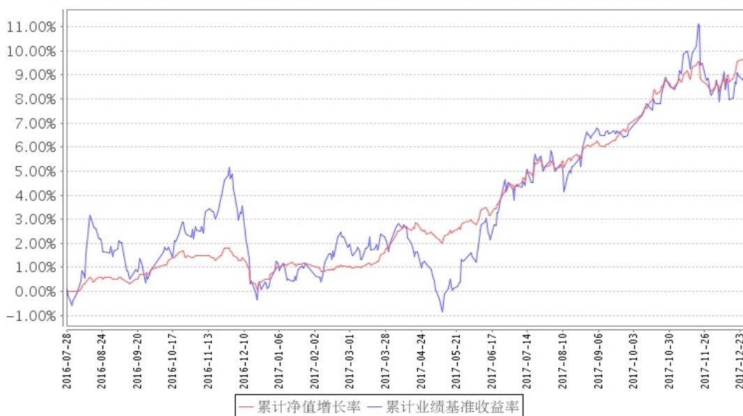
安信新优选混合A累计净值增长率与同期业绩比较基准收益率的历史走势对比图