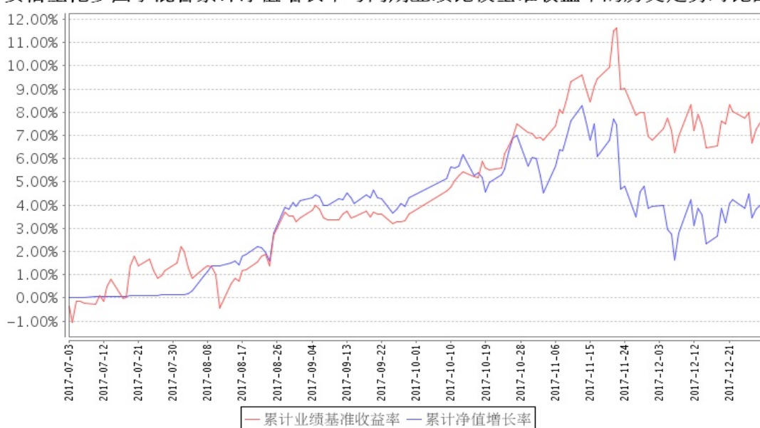
安信量化多因子混合累计净值增长率与同期业绩比较基准收益率的历史走势对比图

注：1、本基金基金合同生效日为 2017 年 7 月 3 日，截至报告期末本基金合同生效未满一年。 2、本基金合同规定，基金管理人应当自基金合同生效之日起六个月内使基金的投资组合比例符合基金合同的约定。截至本报告期末，本基金仍处于建仓期。