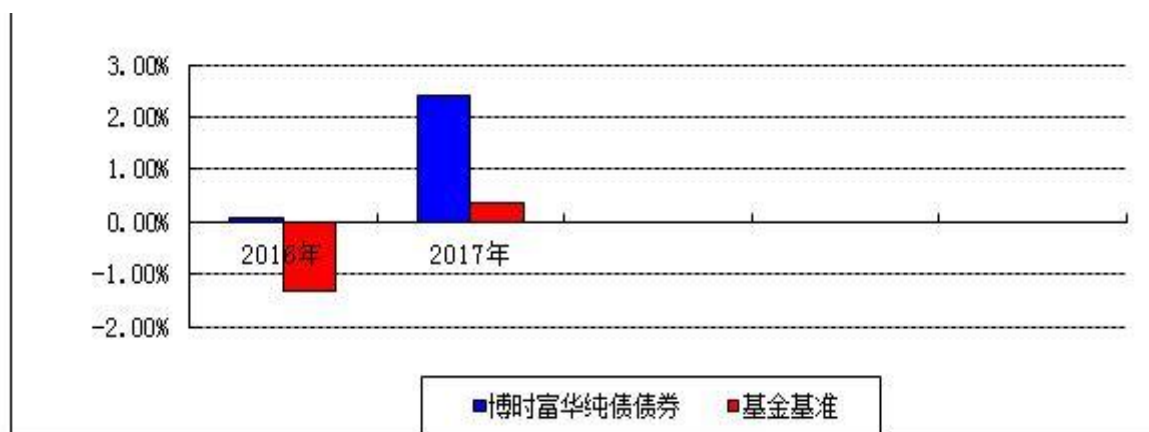
自基金合同生效以来基金净值增长率与业绩比较基准收益率的对比图

注：本基金合同于 2016 年 11 月 25 日生效，合同生效当年按实际存续期计算，不按整个自然年度进行折算。